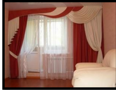
شكل رقم 16