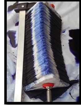
خطوة (11) خطوة (10) خطوة (9)