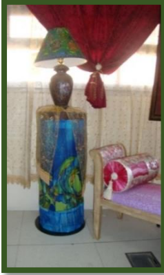
شكل رقم 58

بعض المعطفات وقطع التصميم الداخلي منفذه بالرسم المباشر على الحرير والانتقال الحراري