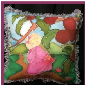
شكل رقم 39