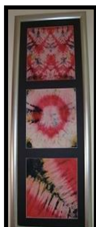
شكل رقم 24