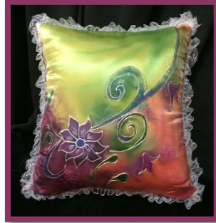
شكل رقم 42