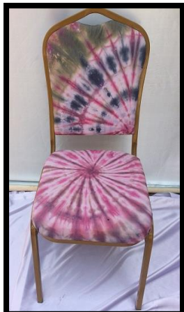
شكل رقم 25