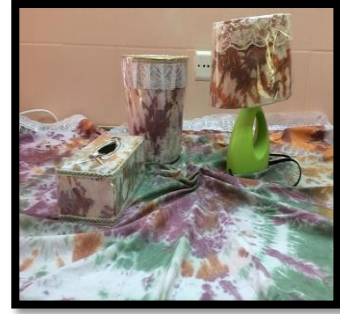
شكل رقم 27