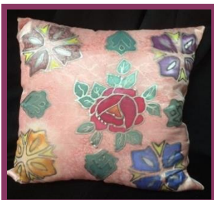
شكل رقم 40