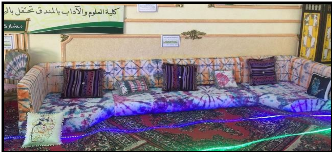
شكل رقم 31

جانب من المعرض المقام بكلية العلوم والآداب بالمنطق كما بالأشكال