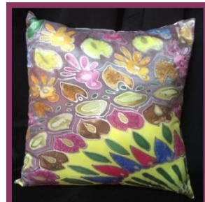
شكل رقم 36