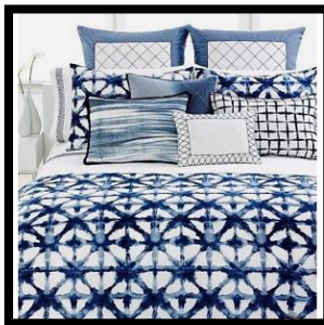
شكل رقم 5