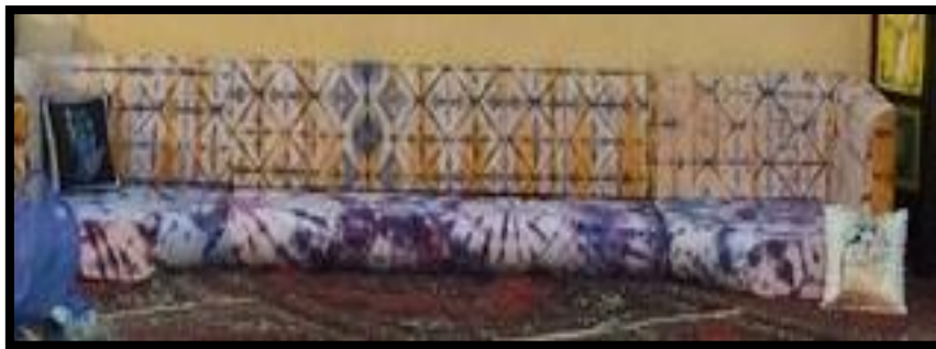
شكل رقم 34