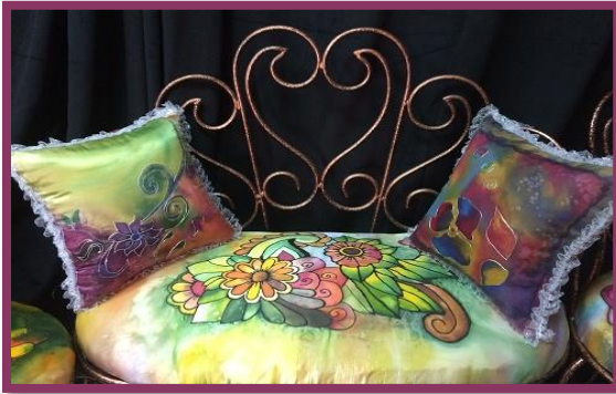
شكل رقم 47

جانب من أعمال الطالبات (وسائد متنوعة وبعض مفردات الديكور والتصميم الداخلي منقذة بالرسم على الحرير)