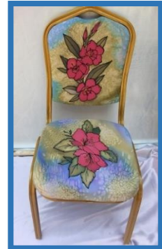
شكل رقم 46