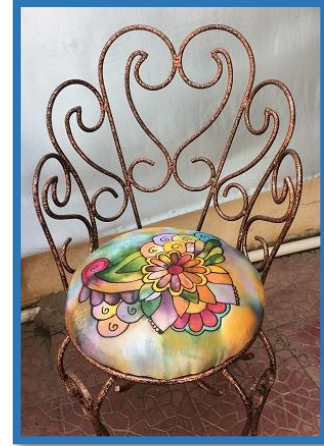
شكل رقم 50

بعض نماذج من قطع الأثاث التي نفذتها الطالبات باستخدام تقنيتي الرسم علي الحرير والانتقال الحراري