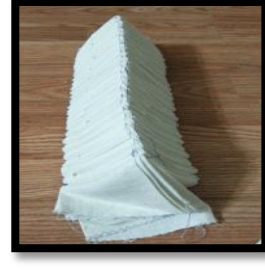
خطوة (8) خطوة (7) خطوة (6)