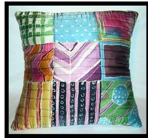
شكل رقم 7