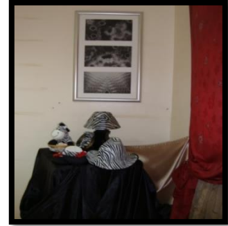
شكل رقم 32