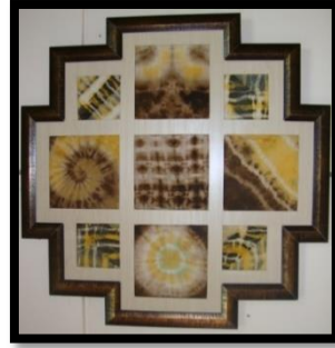
شكل رقم 28