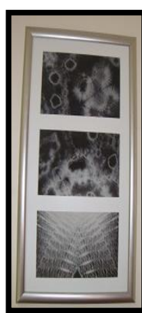
شكل رقم 23