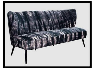
شكل رقم 4