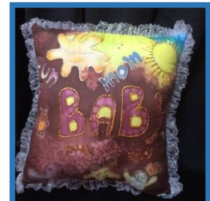
شكل رقم 35