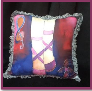
شكل رقم 43