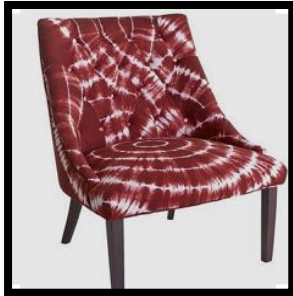
شكل رقم 3

وفيما يلي بعض الاشكال التوضيحية من (1 - 5) لتطبيق أسلوب العقد والربط في التصميم الداخلي.