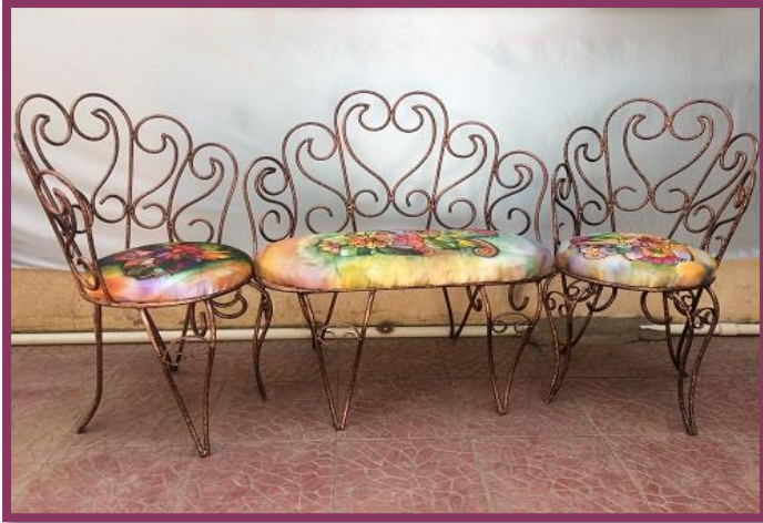
شكل رقم 51