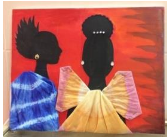
شكل رقم 30

جانب من المعرض المقام بكلية العلوم والآداب بالمنطق كما بالأشكال