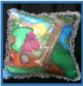
شكل رقم 37