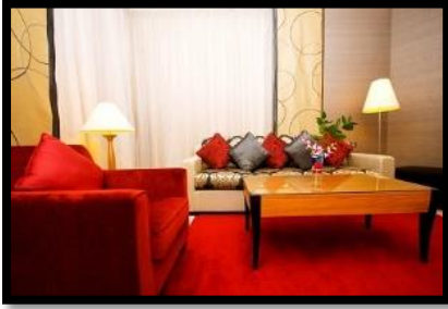
شكل رقم 10

وفيما يلي عرض لبعض نماذج من الوسائد ودورها في التصميم الداخلي كما في الأشكال من 9 - 12.