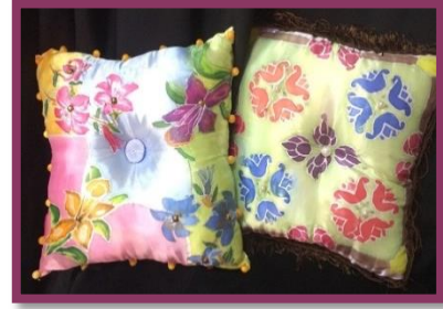
شكل رقم 44

جانب من أعمال الطالبات (وسائد متنوعة وبعض مفردات الديكور والتصميم الداخلي منقذة بالرسم على الحرير)