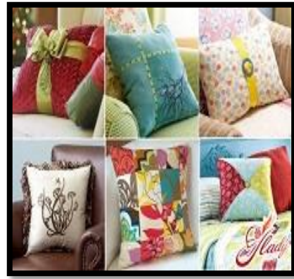
شكل رقم 11