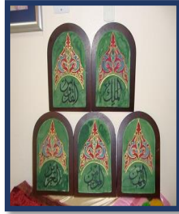
شكل رقم 57

بعض المعطفات وقطع التصميم الداخلي منفذه بالرسم المباشر على الحرير والانتقال الحراري