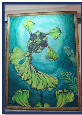
شكل رقم 54