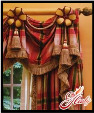
شكل رقم 17