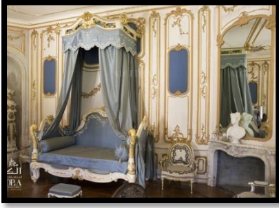
شكل رقم 14

وفيما يلي نماذج لبعض انواع واشكال الستائر باعتبارها أحد المفردات الهامة للتصميم الداخلي بالأشكال من 13 - 17.