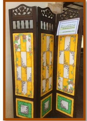
شكل رقم 56