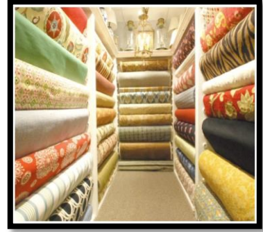
شكل رقم 18