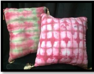
شكل رقم 29