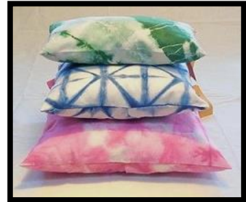
شكل رقم 1