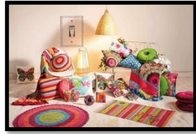
شكل رقم 9