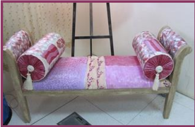
شكل رقم 49