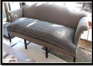
شكل رقم 20

وفيما يلي نماذج لبعض قطع الأثاث وأقمشتها كما بالأشكال من 18 - 21.