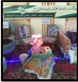
شكل رقم 33