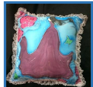
شكل رقم 38