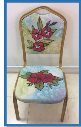
شكل رقم 48