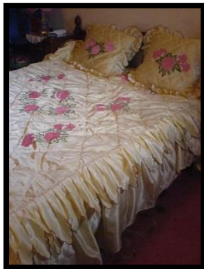
شكل رقم 8

ومن أهم أمثلة الرسم المباشر علي الأقمشة ( الرسم علي الحرير ) ، والحرير يعتبر من ارقى واغنى انواع الأقمشة الحساسة والتي تتطلب دقة ومهارة في التعامل معها عند الرسم عليها، والرسم على الحرير يعتبر من الفنون الرفيعة العالية القيمة نظرا لكلفة الحرير الطبيعي ودقة العمل به، كما انه من الفنون الراقية الجميلة والتي تعتمد على خفة اليد والسرعة في دمج الألوان ، ويستعمل الرسم على الحرير في لوحات الحائط ، القمصان، أغطية الرأس ،المناديل الصغيرة للجيب ، ربطات العنق ، الفساتين النسائية الثمينة، المخدات وغير ذلك من الأعمال الفنية الجميلة . والرسم على الحرير يعتمد في الأساس الأول على سرعه الانتشار وتداخل الألوان مع بعضها البعض بسرعة وهي ميزة تتفرد بها خامه الحرير فتعطي شكل راقي ومحجب، كما أن التصميمات التي يمكن تنفيذها على الحرير لا حدود لها، حيث أننا لا نجد لوحتين متماثلتين تماما أبدا، وربما يكون من الصعوبة أن نحاول تكرار قطعه فنية سبق تنفيذها على الحرير، وهذا ما يجعله فنا متفردا ومتميزا هذا بالإضافة إلى أن ألوانه تتميز بالزهاء والثبات وقوة الاحتمال (9) . وفيما يلي بعض الاشكال التوضيحية من 6: 8 لتطبيق أسلوب الرسم المباشر على الحرير في بعض اكسسوارات ومفردات ومكملات التصميم الداخلي.