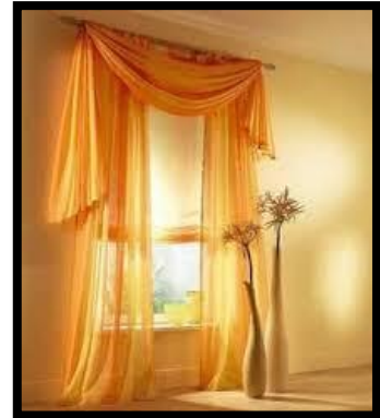
شكل رقم 15