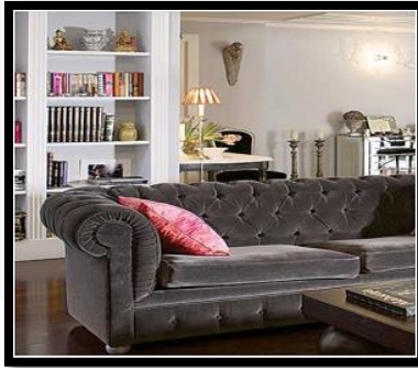
شكل رقم 19