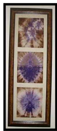
شكل رقم 22