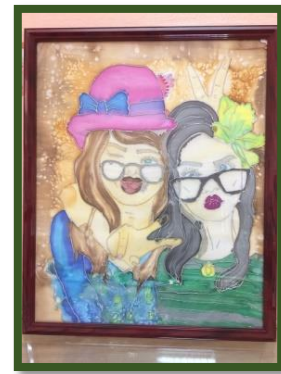
شكل رقم 53