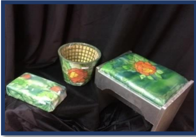
شكل رقم 45