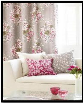
شكل رقم 12