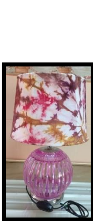
شكل رقم 26