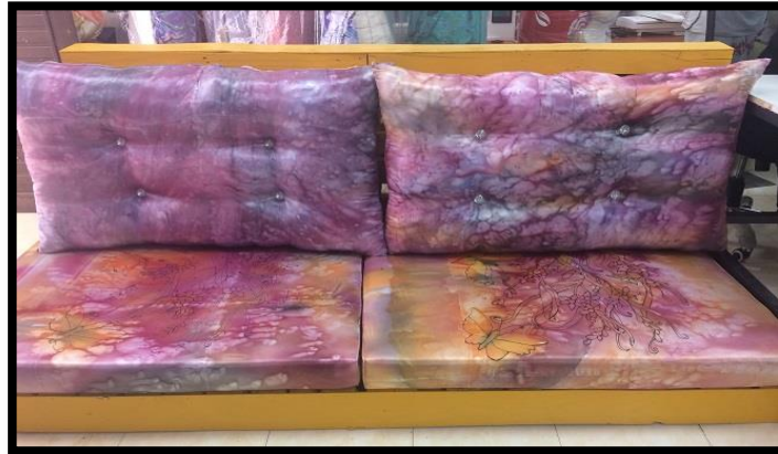
شكل رقم 52

بعض نماذج من قطع الأثاث التي نفذتها الطالبات باستخدام تقنيتي الرسم علي الحرير والانتقال الحراري