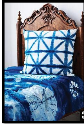
شكل رقم 2