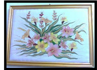
شكل رقم 6