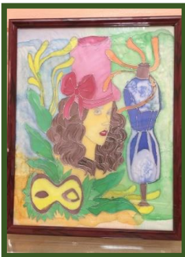
شكل رقم 55

شكل رقم 52 عبارة عن قطعه أثاث ( مجلس عربي) نفذت قاعدته من الخشب المستهلك للصناديق كإعادة تدوير واستخدامه في منتج نافع وتنجيده من قماش الساتان ومزخرف بأسلوب الرسم علي الحرير.