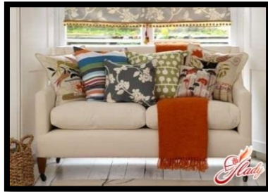
شكل رقم 21