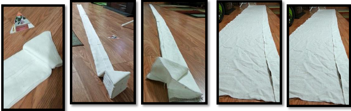
خطوة (5) خطوة (4) خطوة (3) خطوة (2) خطوة (1)

قامت الطالبات وتحت اشراف الباحثة بطي الأقمشة حسب الطرق المتبعة والتي تم دراستها في هذا الاسلوب الطباعي، وقد تم اتباع الطريقة التالية في الطي والربط كما موضح بالخطوات من (1) الي (11) ، وتم الحصول علي الأقمشة المزخرفة بالتأثيرات المميزة للعقد والربط والتي استخدمت في منتجات وأثاث التصميم الداخلي وكذلك اكسسواراته المتنوعة . كما هو موضح بالنماذج رقم 22- 30