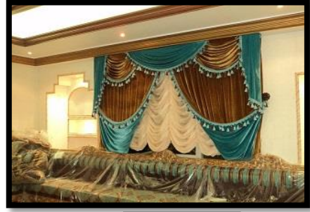
شكل رقم 13